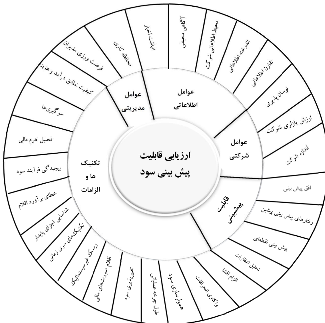
نگاره ۲. الگوی ارزیابی قابلیت پیش بینی سود